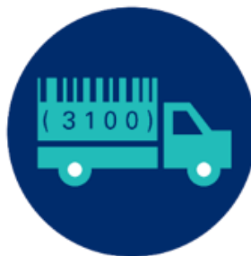
Szállítás és logisztika